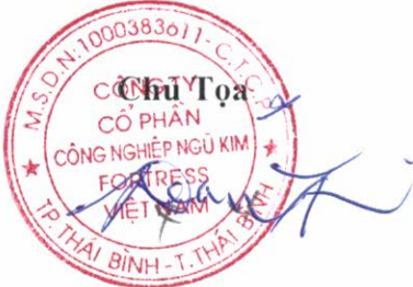
TSAI CHUI TIEN

Nghị quyết của Đại hội đồng cổ đông bất thường lần 2 năm 2021 sẽ được lập thành văn bản để thông báo đến toàn thể Cổ đông theo đúng qui định của Pháp luật.