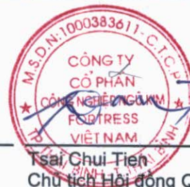
Tsai Chui Tien Chủ tịch Hội đồng Quản trị