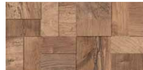
Fascia Tredi / SA 9 20x40 8"x16" □042