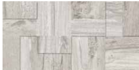
Fascia Tredi / SA 5 20x40 8"x16" □042