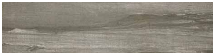
SA 15 20x80 8"x32" □077