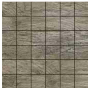
Mosaico / SA 15 30x30 12"x12" □206