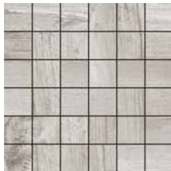
Mosaico / SA 5 30x30 12"x12" □206