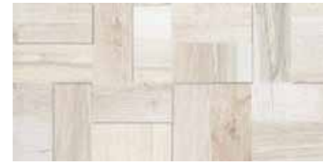
Fascia Tredi / SA 1 20x40 8"x16" □042