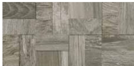
Fascia Tredi / SA 15 20x40 8"x16" □042