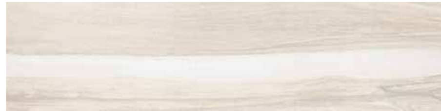
SA 1 20x80 8"x32" □077