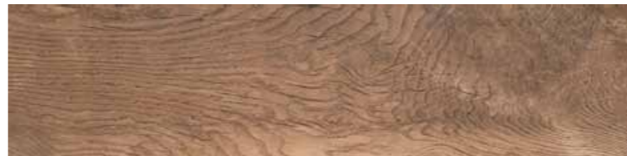
SA 9 20x80 8"x32" □077