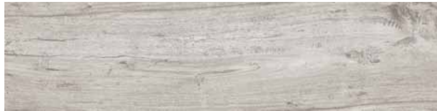
SA 5 20x80 8"x32" □077