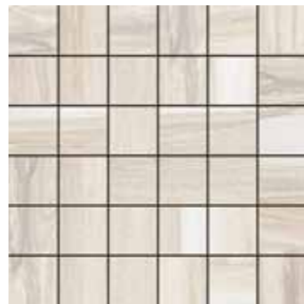
Mosaico / SA 1 30x30 12"x12" □206