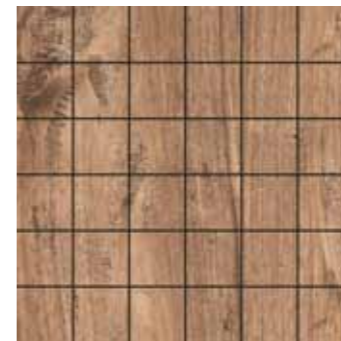
Mosaico / SA 9 30x30 12"x12" □206