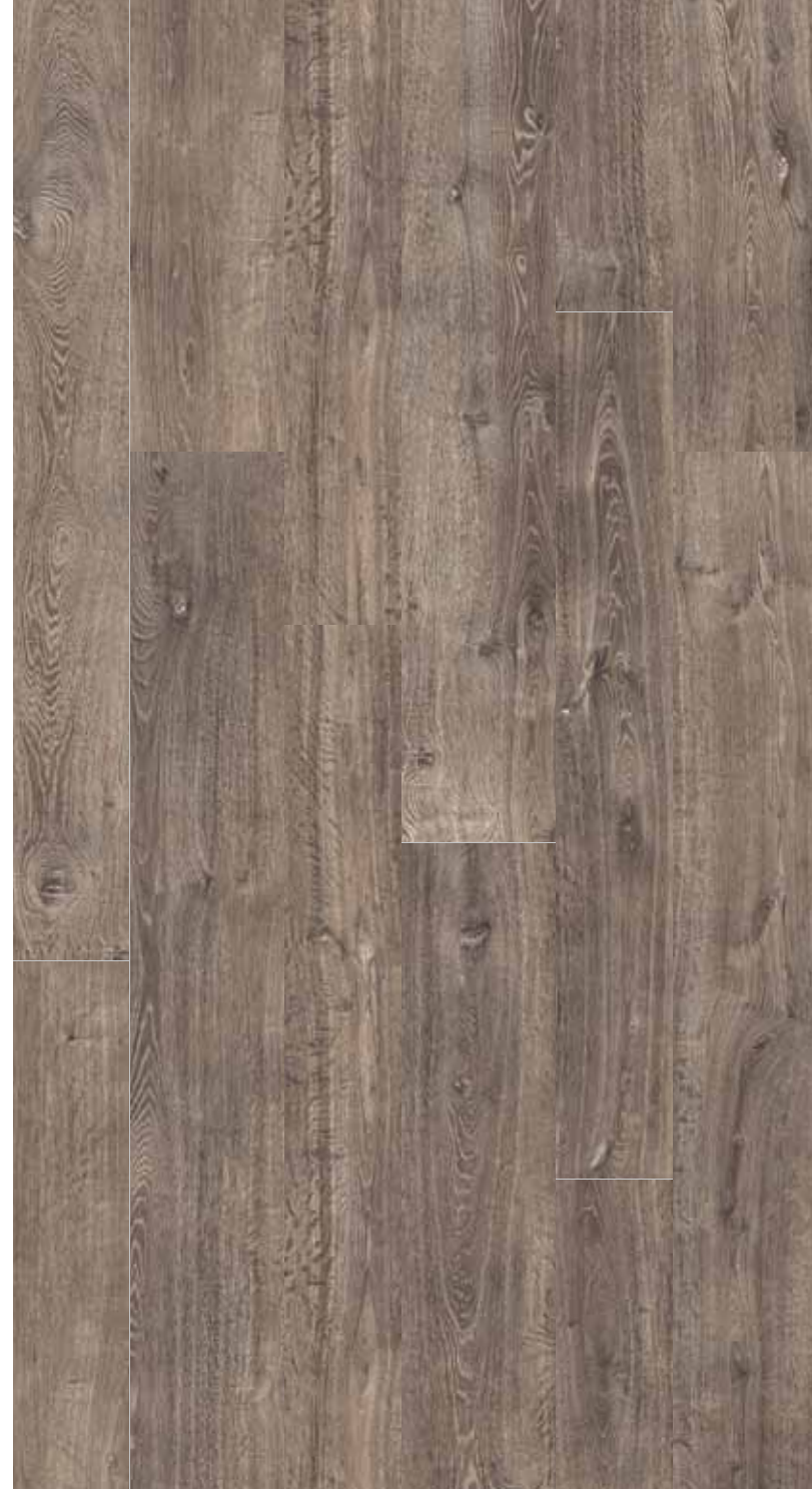
OB 3 Rett.