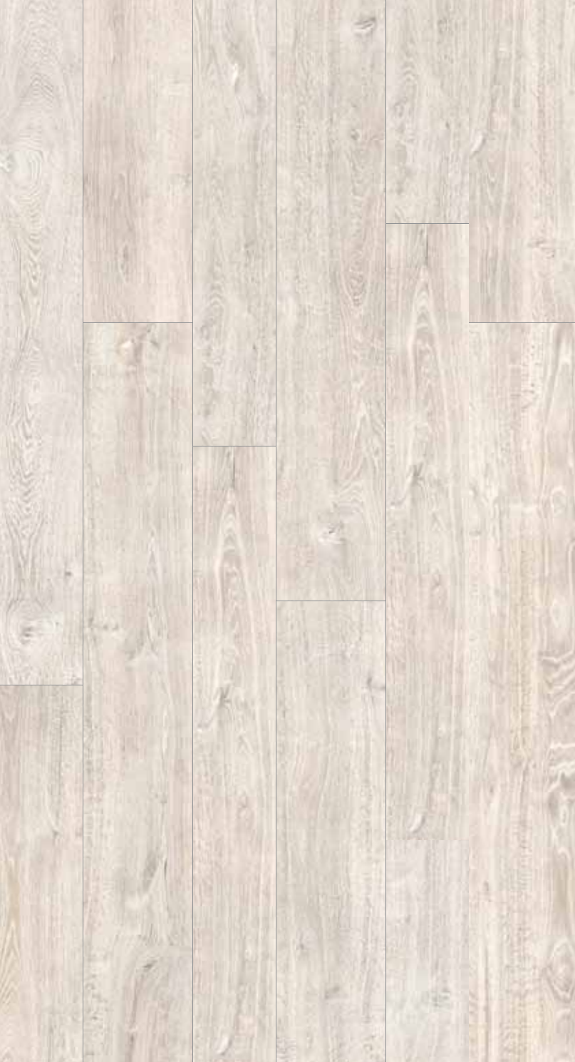
OB 10 Rett.