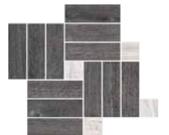
Mosaico / OB 8 41x35 cm 16 1 / 8 x13 6 / 8 in 293