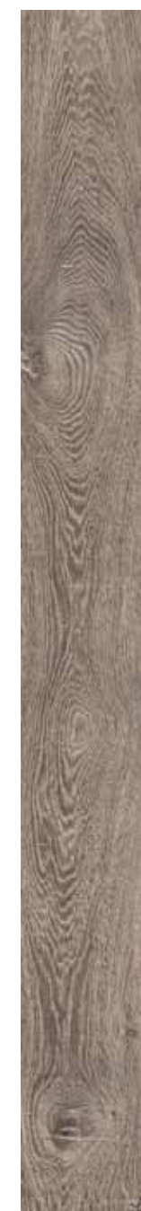
OB 3 Rett. 20x180 cm 8x71 in 146