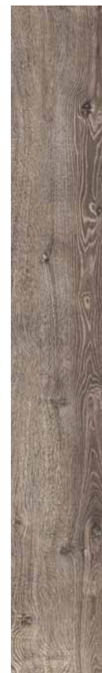
OB 3 Rett. 26,5x180 cm 10 3 / 8 x71 in 146