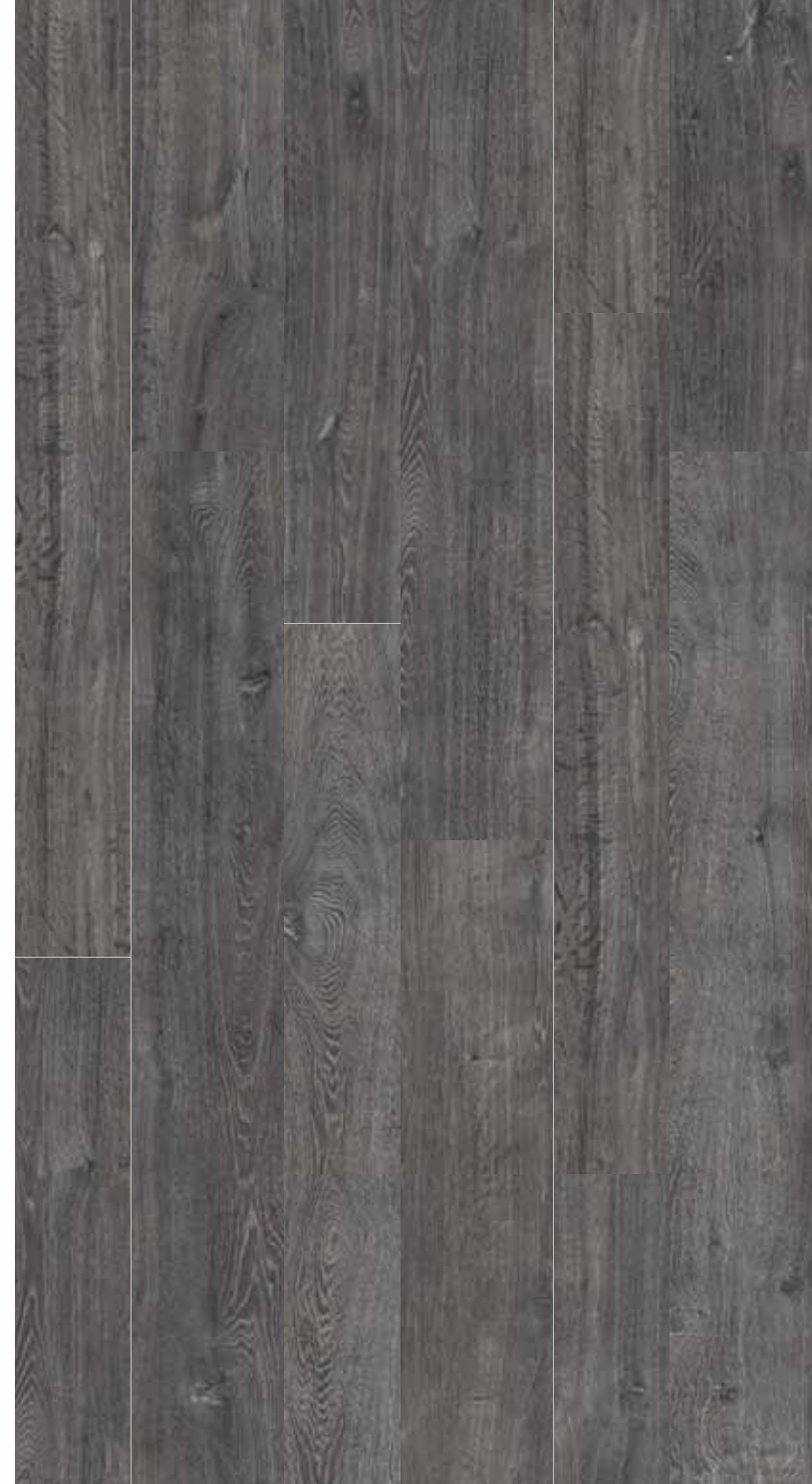
OB 8 Rett.