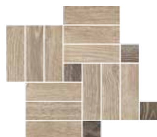
Mosaico / OB 1 41x35 cm 16 1 / 8 x13 6 / 8 in 293