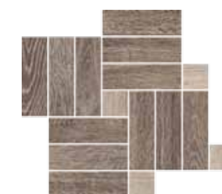
Mosaico / OB 3 41x35 cm 16 1 / 8 x13 6 / 8 in 293