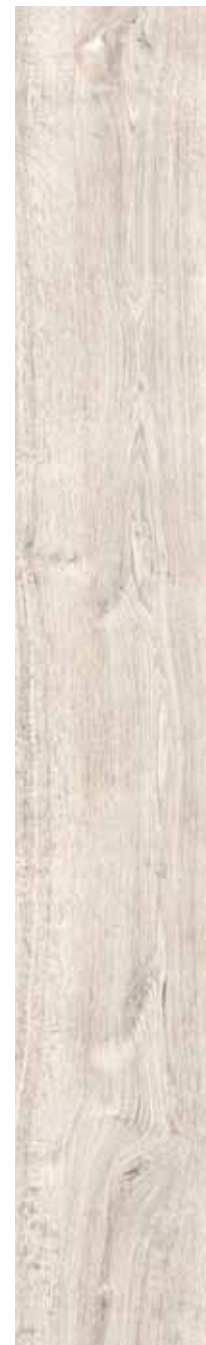
OB 10 Rett. 26,5x180 cm 10 3 / 8 x71 in 146