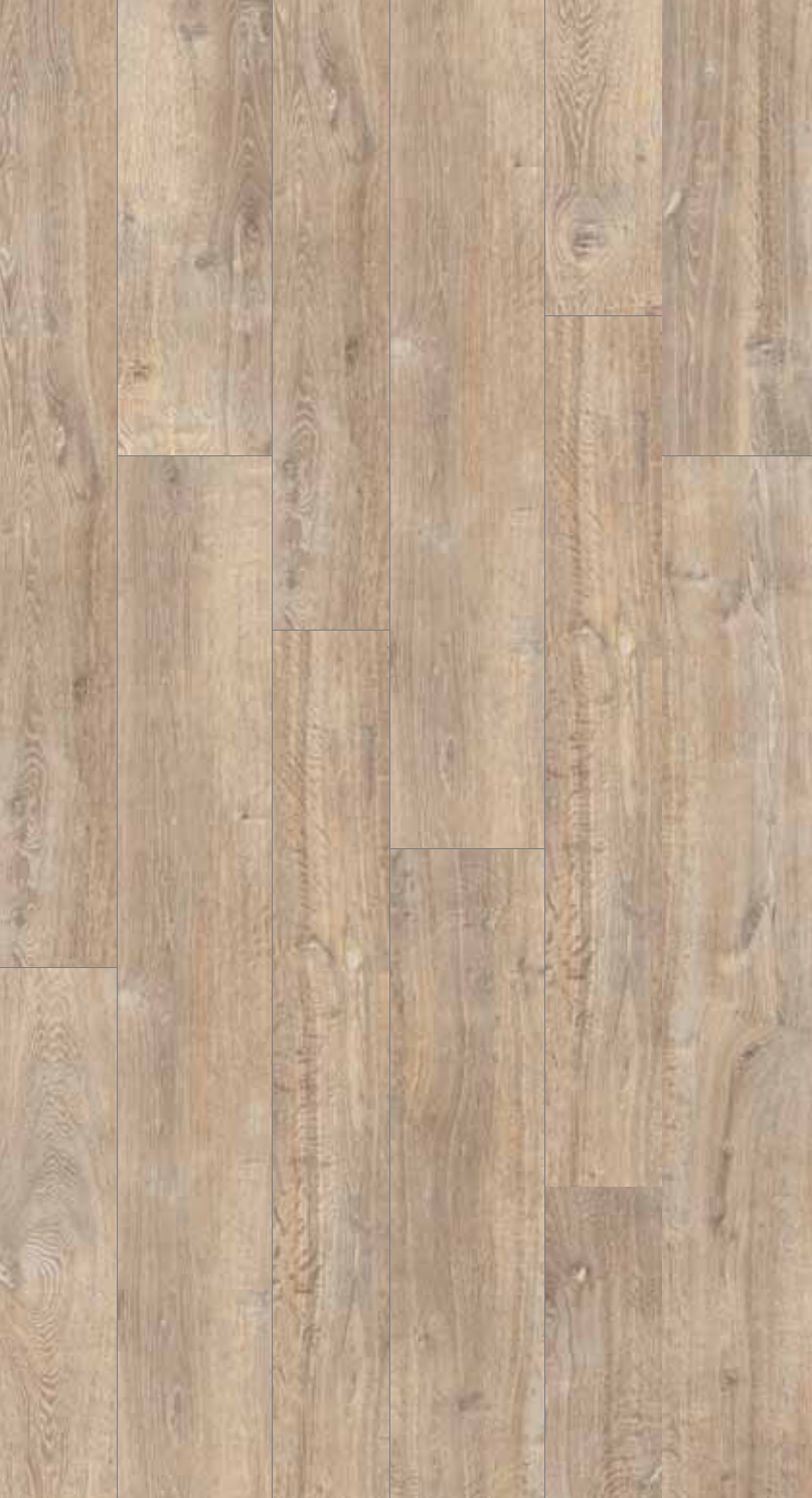
OB 1 Rett.