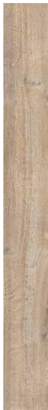
OB 1 Rett. 20x180 cm 8x71 in 146