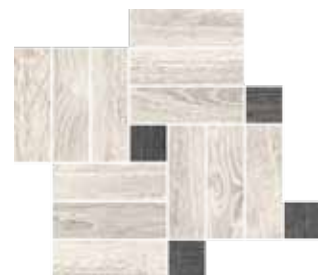
Mosaico / OB 10 41x35 cm 16 1 / 8 x13 6 / 8 in 293