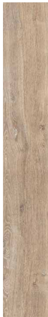
OB 1 Rett. 26,5x180 cm 10 3 / 8 x71 in 146