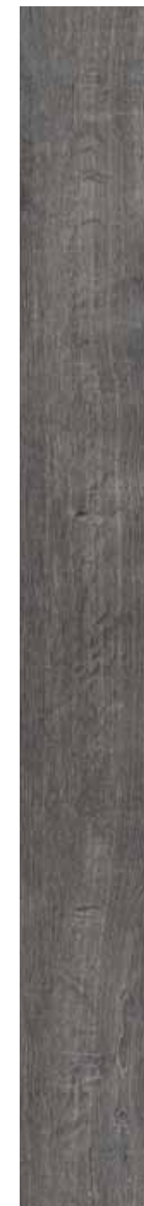
OB 8 Rett. 20x180 cm 8x71 in 146