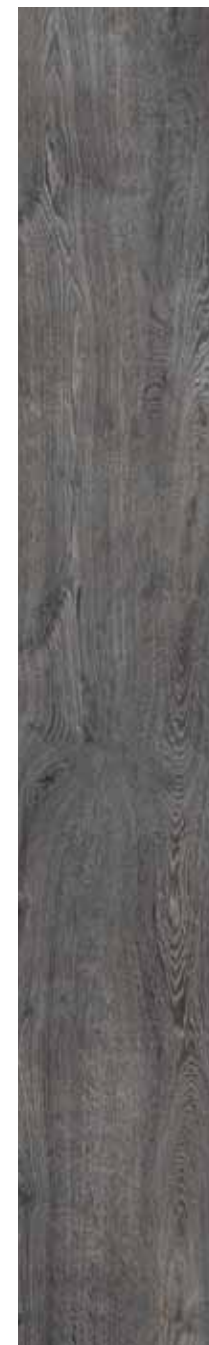
OB 8 Rett. 26,5x180 cm 10 3 / 8 x71 in 146