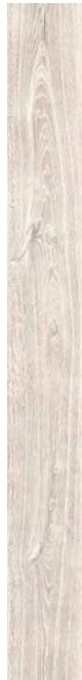
OB 10 Rett. 20x180 cm 8x71 in 146