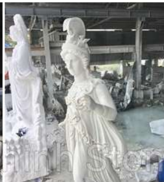
5. Điều khắc chi tiết