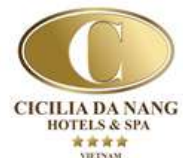
Cicilia Hotel & Spa