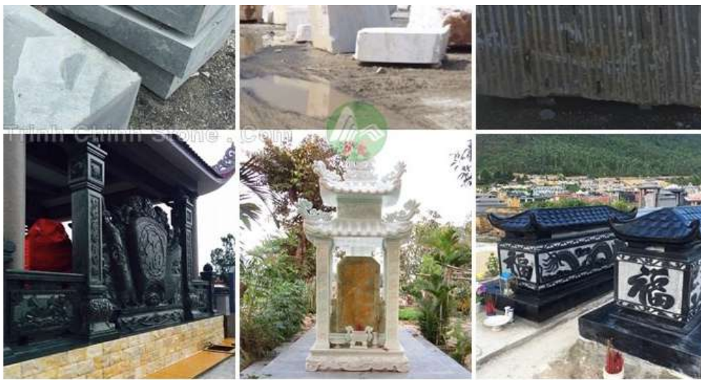
Đá xanh thanh hóa, đá trắng cẩm thạch nghệ an, đá đen & xám nghệ an, đá xanh lục bích ấn độ.