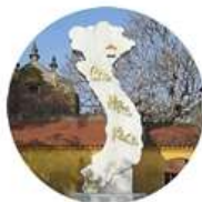
Chùa Hưng Khánh