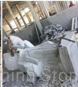
2. Tạo khung tượng