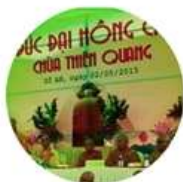
Chùa Thiện Quang

Chúng tôi tạc 4500+ tượng đá từ năm 1996 đến nay cho Chùa, và Nhà Thờ lớn ở Việt Nam & Châu Âu