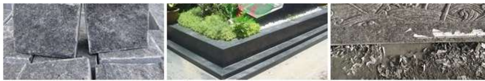
Đá Granite nhiều màu (đen, trắng sứ lau & xanh bửu long).