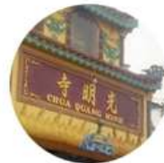
Chùa Quang Minh