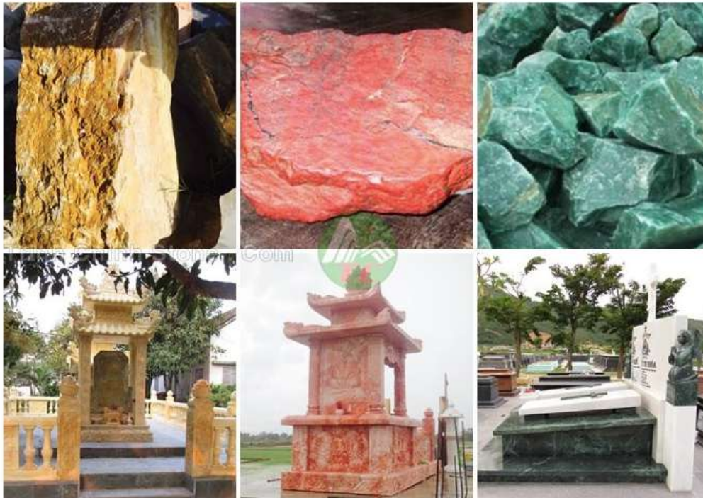
Đá xanh thanh hóa, đá trắng cẩm thạch nghệ an, đá đen & xám nghệ an.