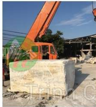
1. Chọn đá khối

Đóng gói đạt chuẩn xuất khẩu, hỗ trợ lắp đặt a đến z & bảo hành.