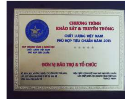
Khảo sát & truyền thông Chất lượng Việt Nam