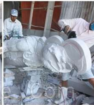
3. Tạo khung cơ thể