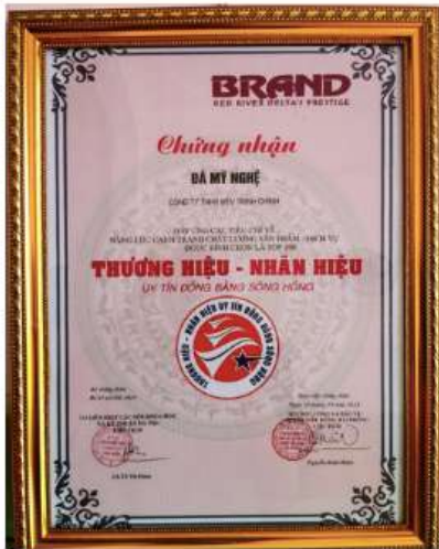
Thương hiệu & nhãn hiệu uy tín đồng bằng sông hồng

Đảm bảo nguồn đá tự nhiên & chất lượng chạm khắc chi tiết.