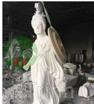
4. Điều khắc tạo hình cơ bản