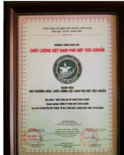
Chất lượng Việt Nam phù hợp tiêu chuẩn