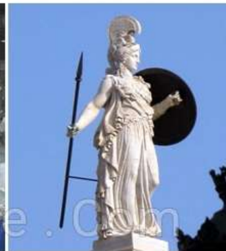
6. Điều khắc chi tiết nét mặt, gân, cơ bắp & thần thái