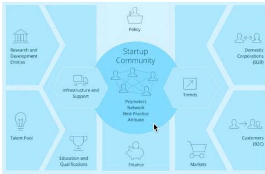
Hình 2. Bức tranh Hệ sinh thái Doanh nghiệp. 9

Xếp hạng Hệ sinh thái Khởi nghiệp Toàn cầu (2015) đã áp dụng một cách tiếp cận hơi khác và đánh giá hệ sinh thái dựa theo hoạt động và sự tăng trưởng của nó. Xếp hạng này dựa trên “Bức tranh hệ sinh thái doanh nghiệp” (ban đầu dựa trên sản phẩm nghiên cứu của Trung tâm Năng suất và Sáng tạo Đức). Nó dựa trên mười một thành phần bao gồm những lĩnh vực chính của hệ sinh thái khởi nghiệp. Những thành phần này gồm có: Ý tưởng và Nhân tài, Hỗ trợ và cơ sở hạ tầng, Cộng đồng khởi nghiệp, Chính sách và Tài chính, Xu hướng và Thị trường.