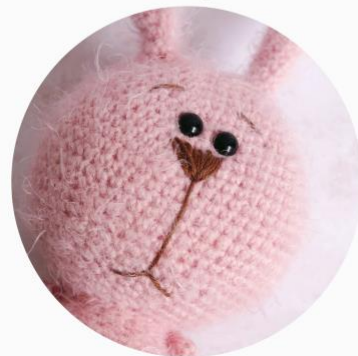
Len Lén Lén Len ^^