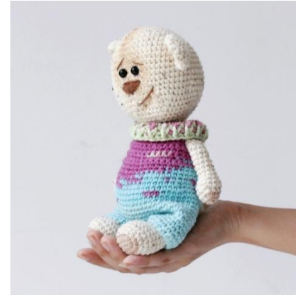
Chú Gấu Bắc Cực Pum Pum là một mẫu thú bông thuộc bộ sưu tập thú bông của Len Len Len. Đây cũng là một món quà rất là dễ thương cho bé nhé ^^