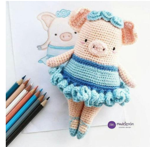
Nàng Heo Larissa

Nàng Heo Larissa là một mẫu thú bông thuộc bộ sưu tập thú bông của Len Lèn Lèn Len. Bạn ấy sẽ là một món quà rất là dễ thương cho bé đó ạ ^^