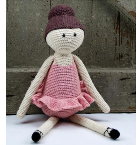
Búp bê Balle

Búp bê Balle là một mẫu thú bông thuộc bộ sưu tập thú bông của Len Len Len. Bạn ấy sẽ là một món quà rất là dễ thương cho bé đạ ^^