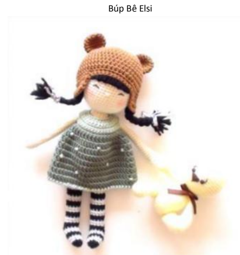
Búp Bê Elsi

Búp Bê Elsi là một mẫu thú bông thuộc bộ sưu tập thú bông của Len Len Len. Bạn ấy sẽ là một món quà rất là dễ thương cho bé đó ạ ^^