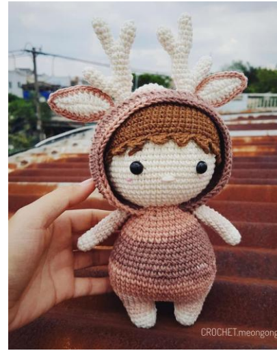
Bé mũ nai Renly là một mẫu thú bông thuộc bộ sưu tập của Len Len Len. Bạn ấy sẽ là một món quà rất là dễ thương cho bé đó ạ ^^